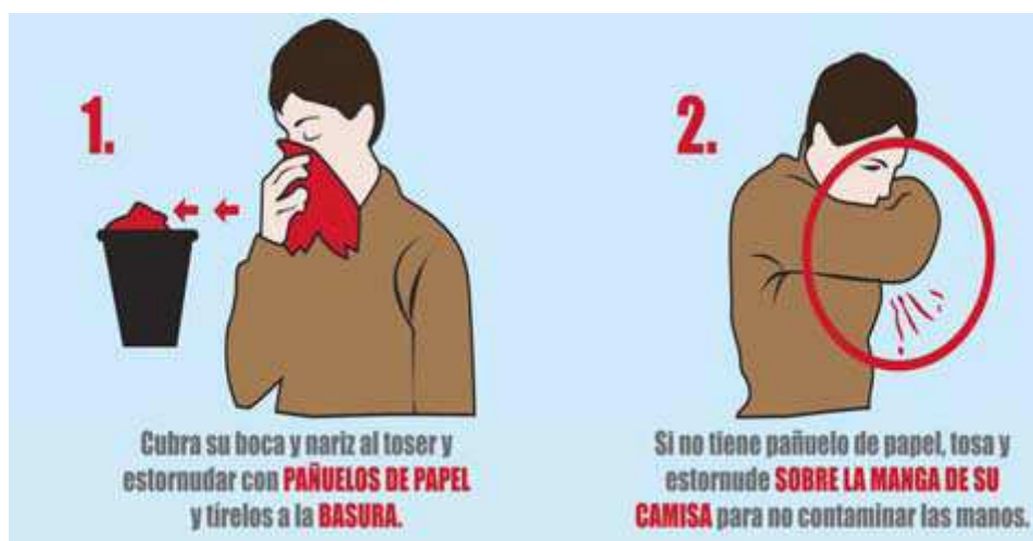
Figura 2.- Método de higiene respiratoria

Hay que alentar al personal del centro escolar a: