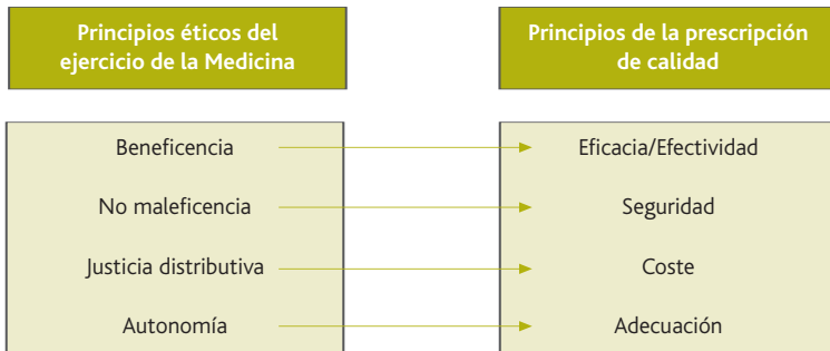
Figura 2. Principios éticos de la prescripción de calidad